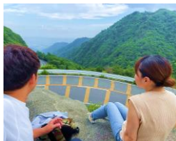
シンプル思考で生きやすく - 青空セッション -