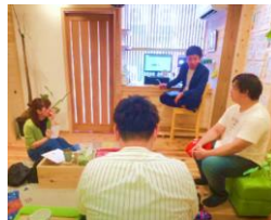
背中を押し合える仲間と一緒に - グループセッション -