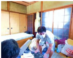
何事も土台あってこそ - お掃除セッション -